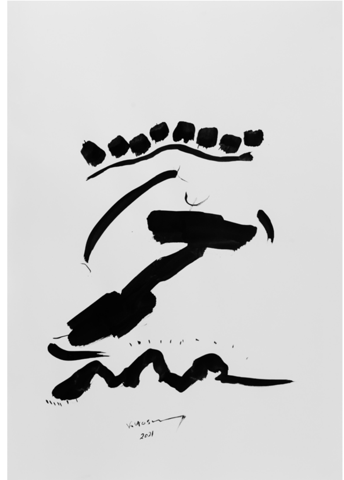
Ink on Paper 70 x 100 cm 2021