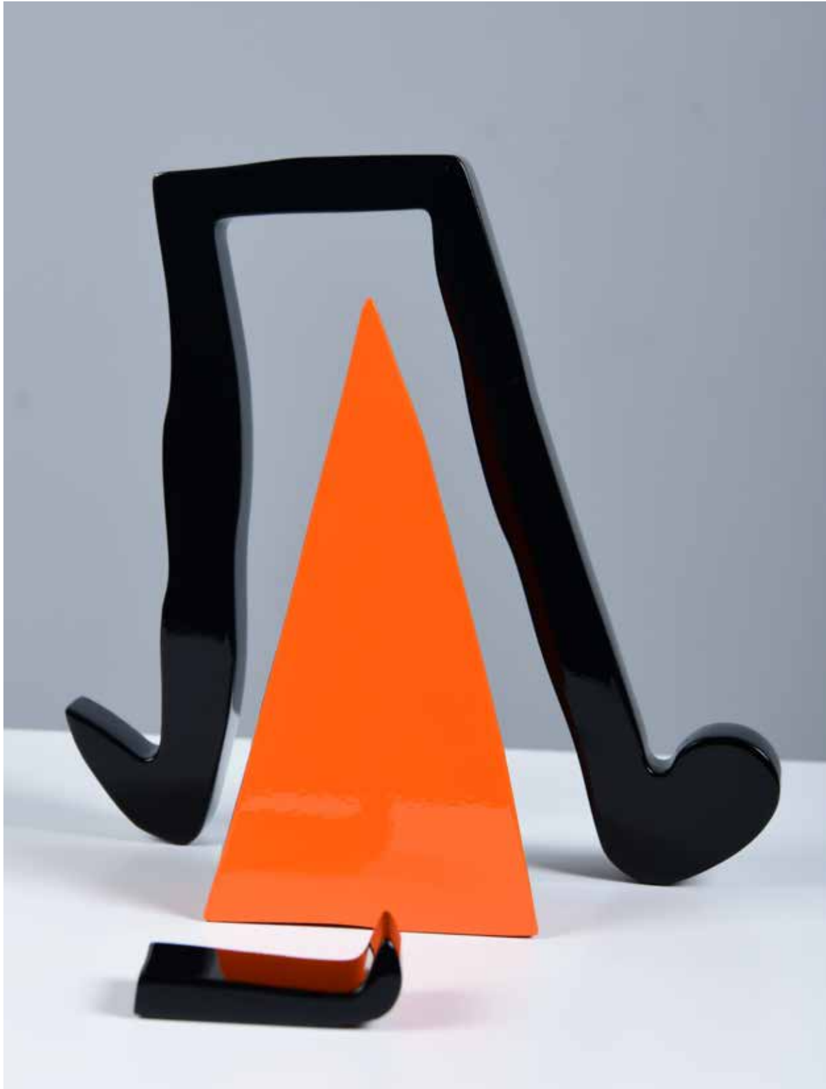
Orange Pyramid Painting on Aluminum 70 x 50 x 6 cm 2021