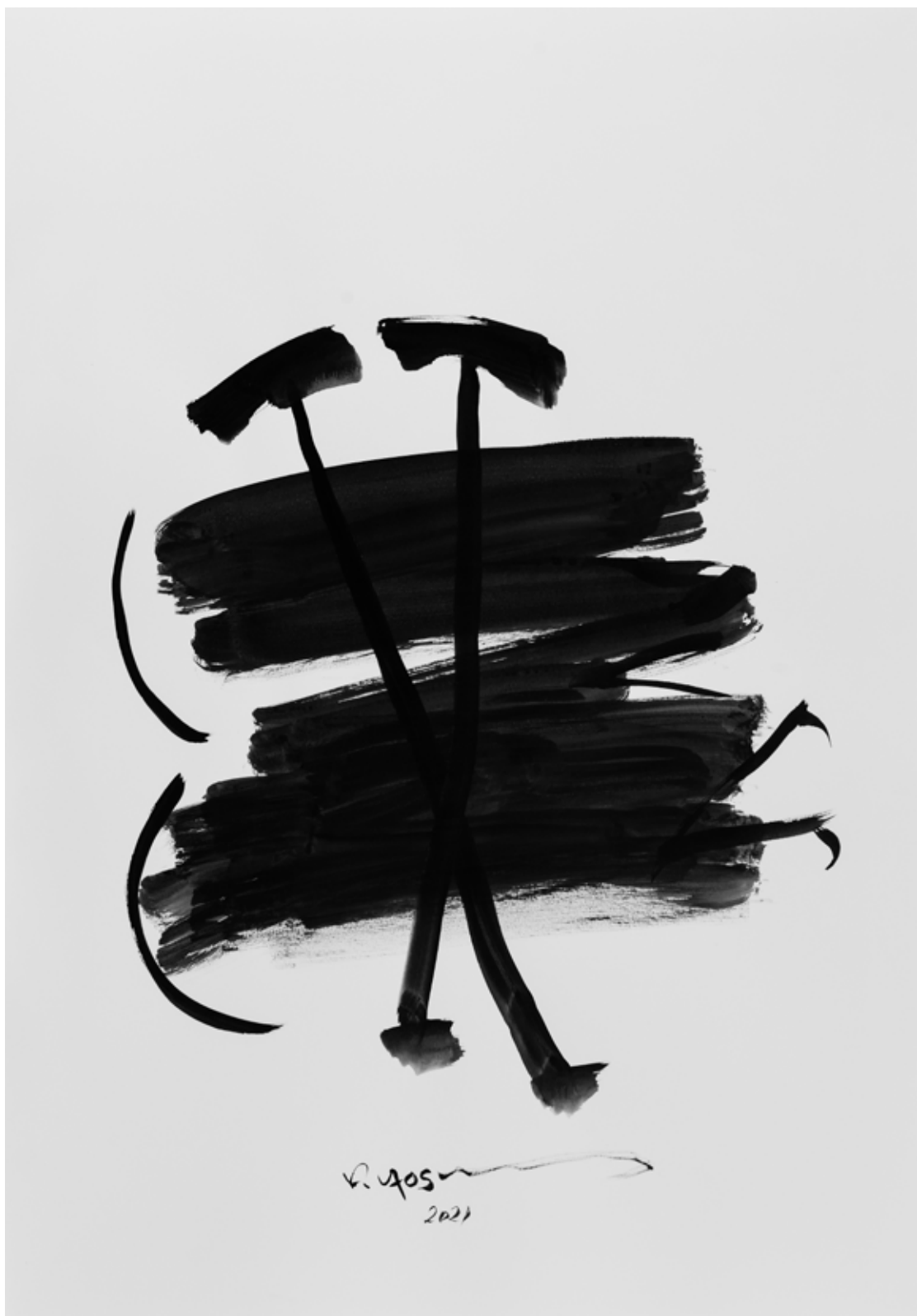
Ink on Paper 70 x 100 cm 2021