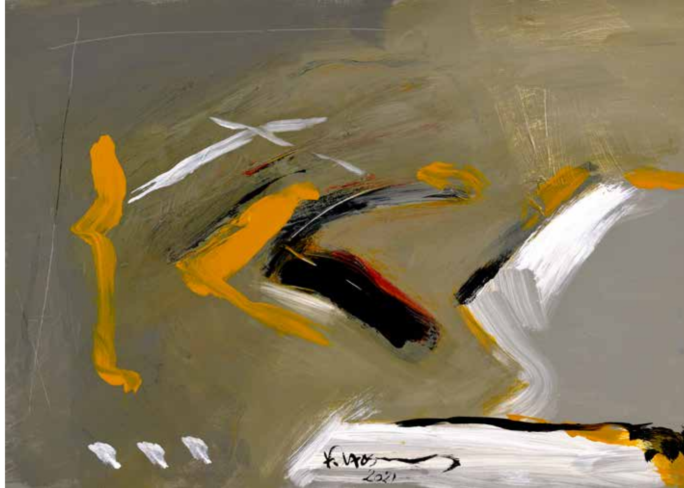
Acrylic Painting on Canvas 50 x 70 cm 2021

على الرغم من إفتقادها لموضوع محدد ، فإن لوحات فاروق حسنى قابلة للفهم من المشاهد على انها تفسير تجريدى لطواهر بصرية فى عالم الواقع .