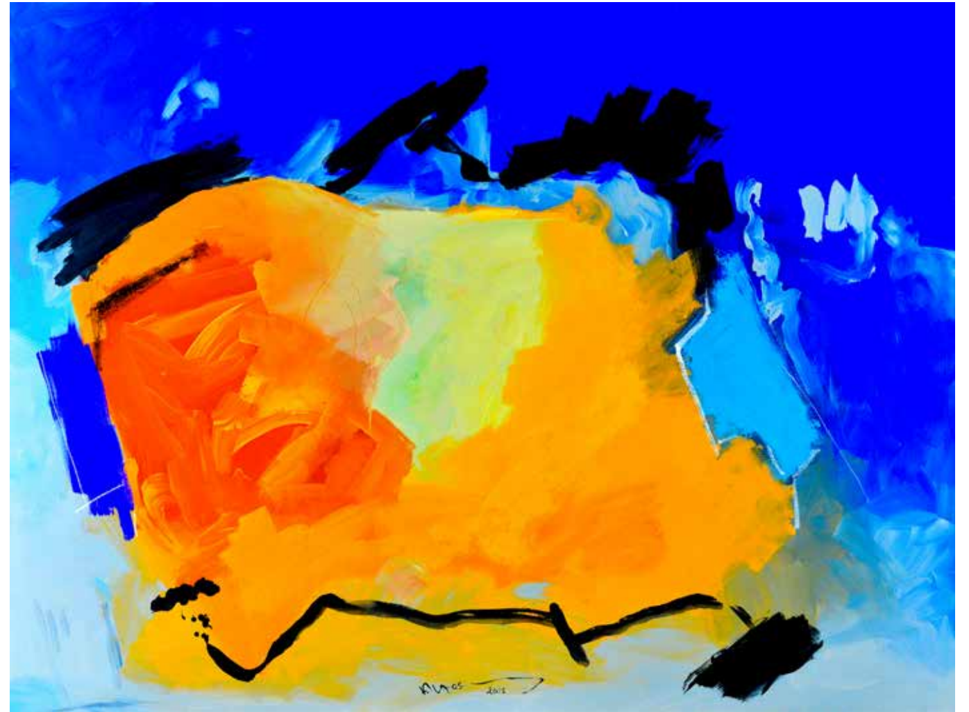
Acrylic Painting on Canvas 150 x 200 cm 2018