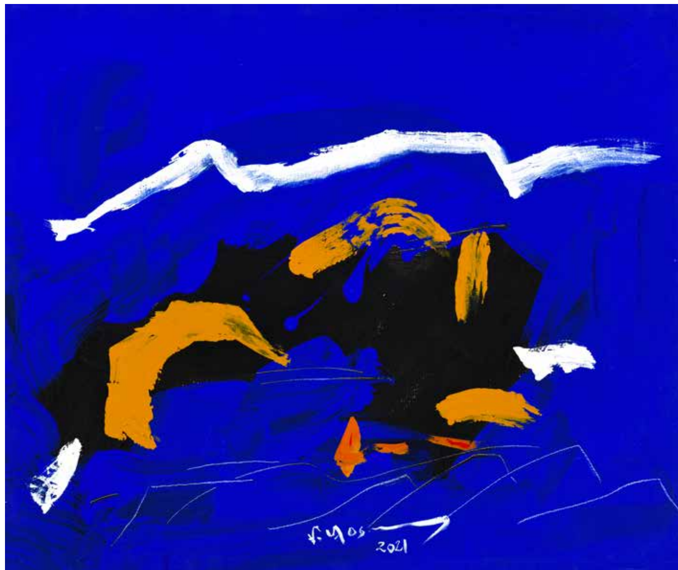
Acrylic Painting on Canvas 120 x 180 cm 2021