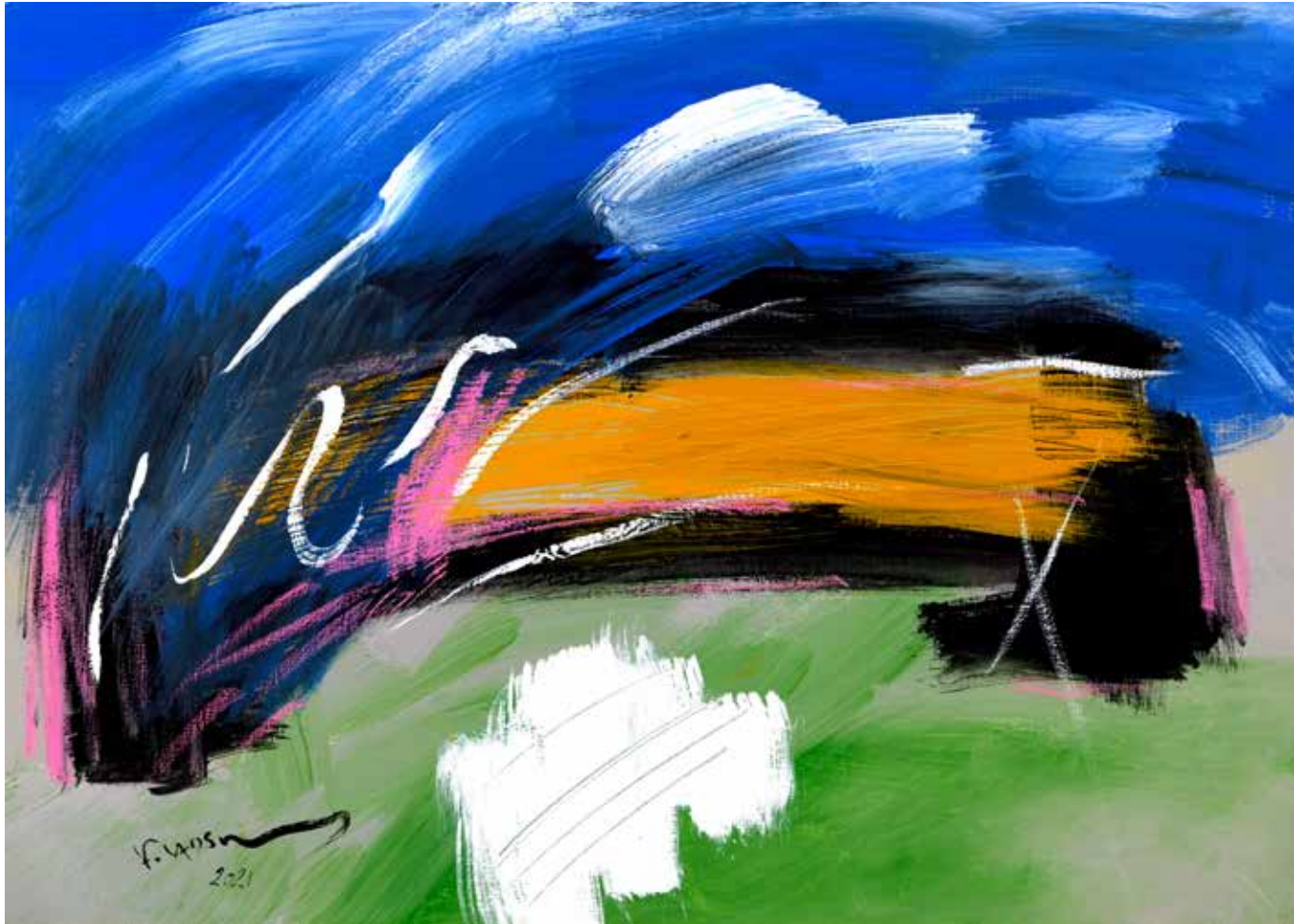
Acrylic Painting on Canvas 50 x 70 cm 2021