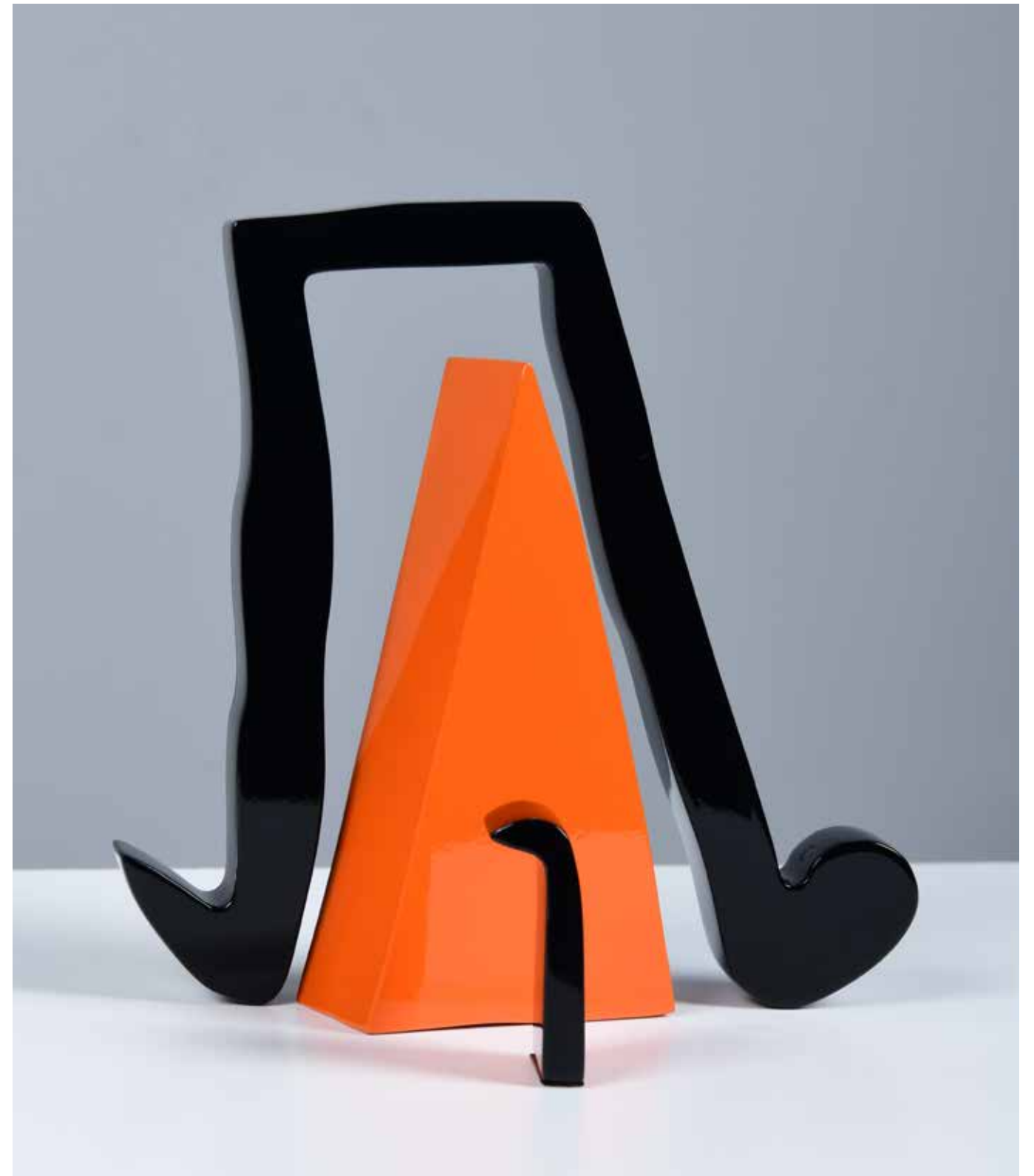
Orange Pyramid Painting on Aluminum 70 x 50 x 6 cm 2021