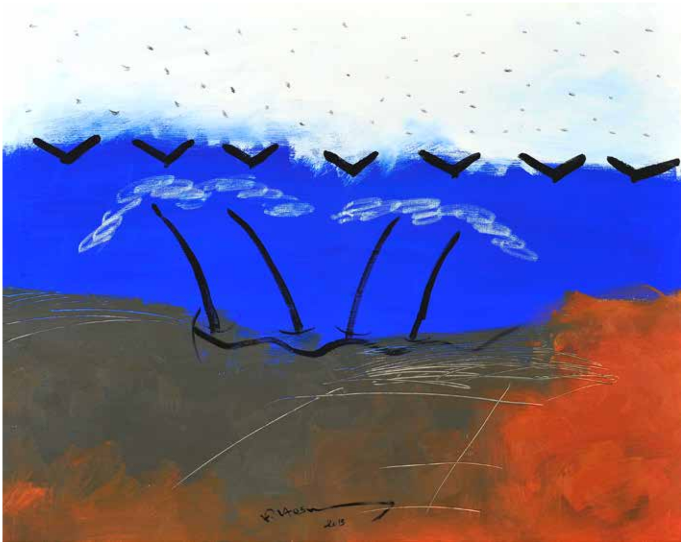
Acrylic Painting on Canvas 80 x 100 cm 2013