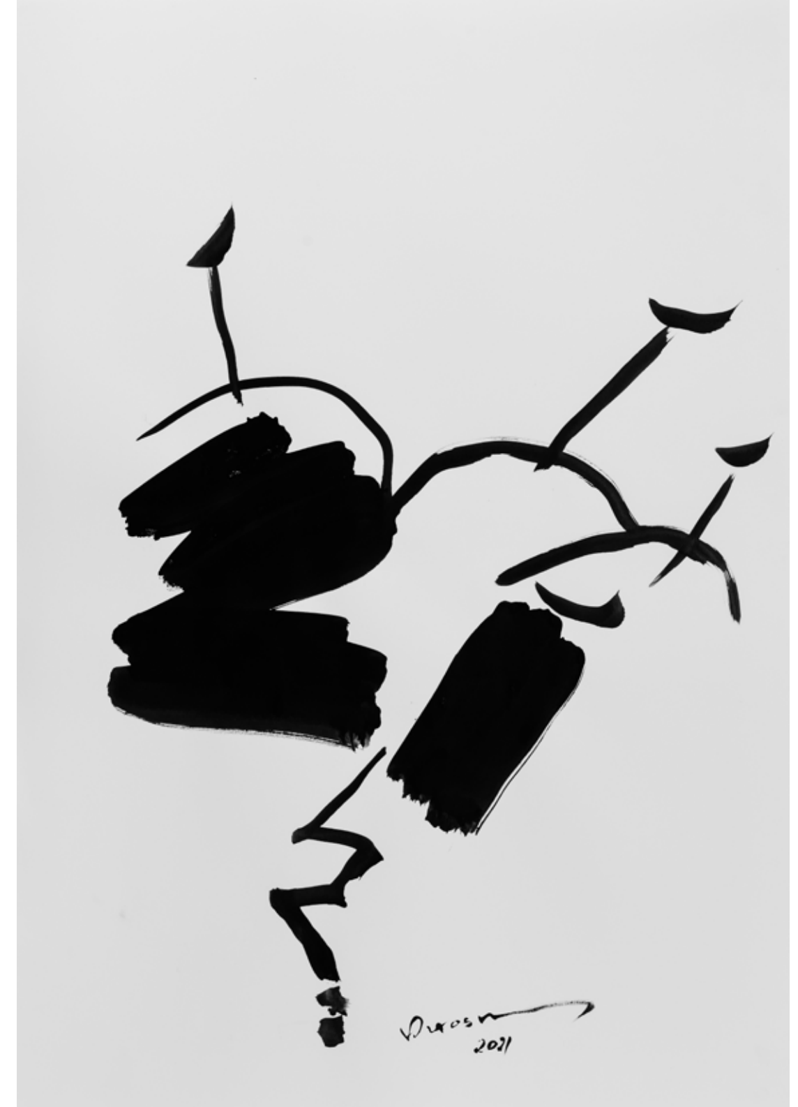
Ink on Paper 70 x 100 cm 2021