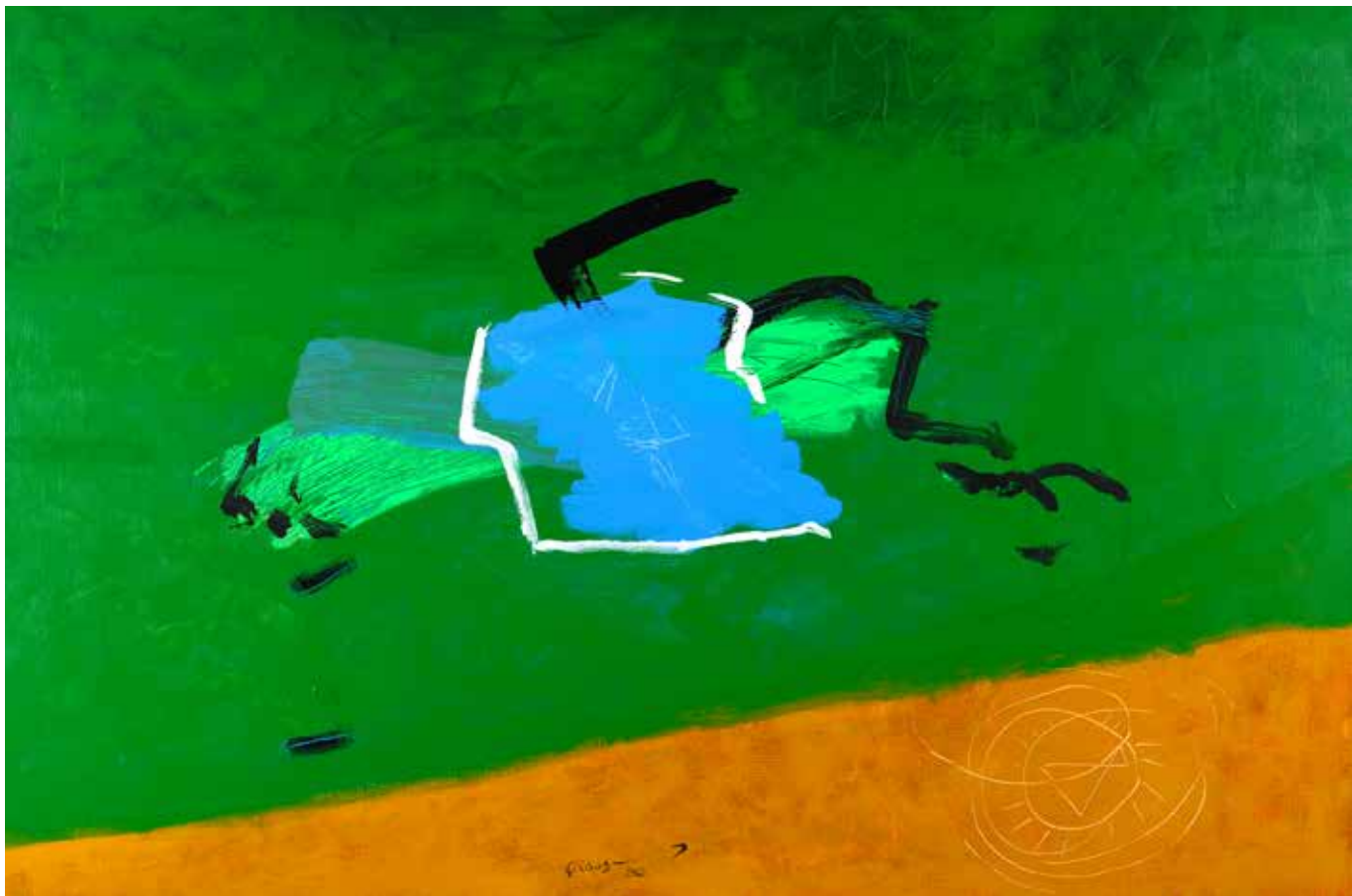
Acrylic Painting on Canvas 120 x 180 cm 2021