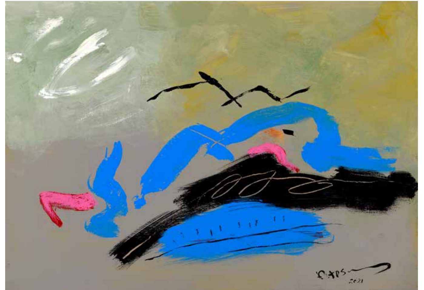
Acrylic Painting on Canvas 50 x 70 cm 2021