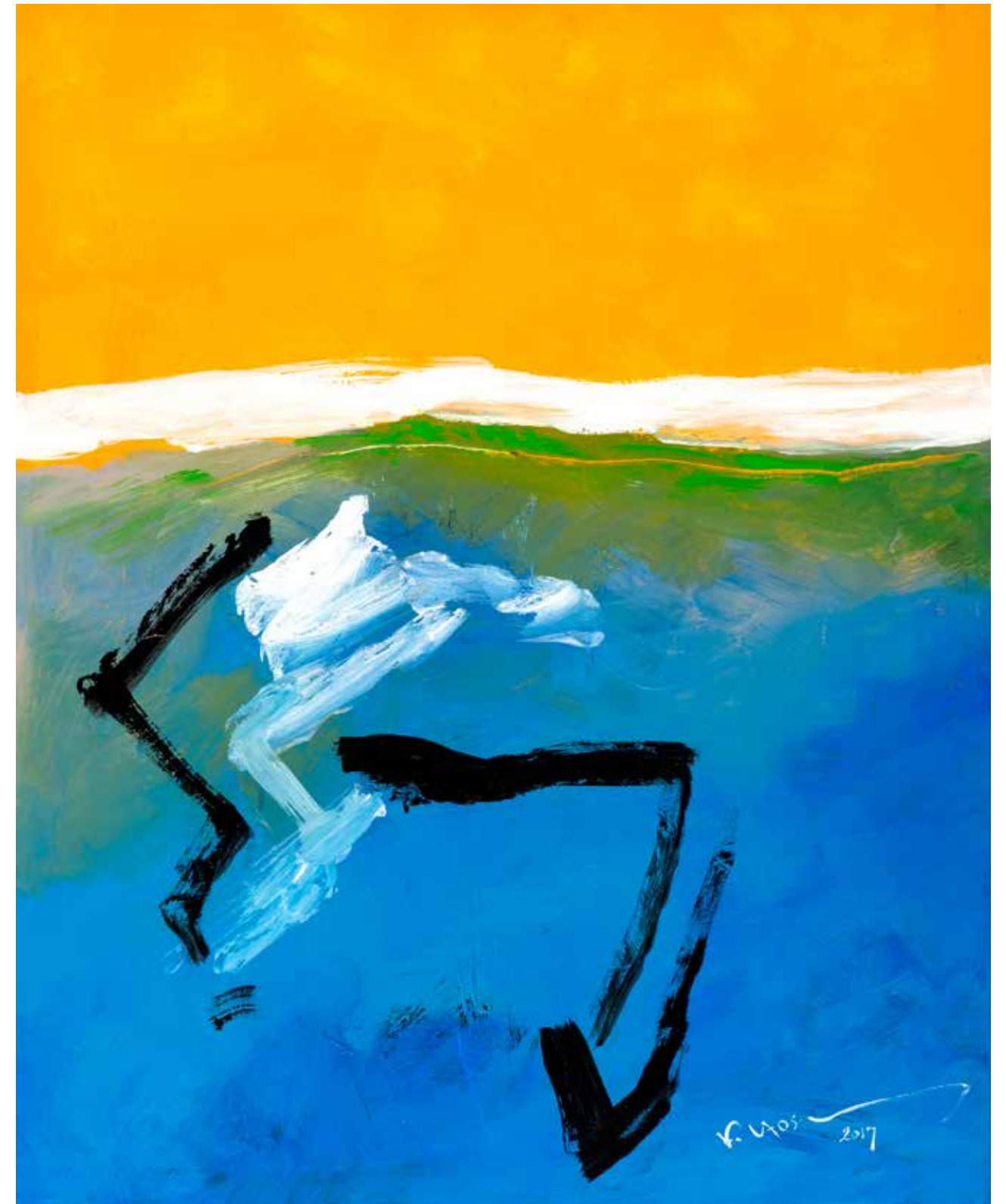
Acrylic Painting on Canvas 100 x 80 cm 2017