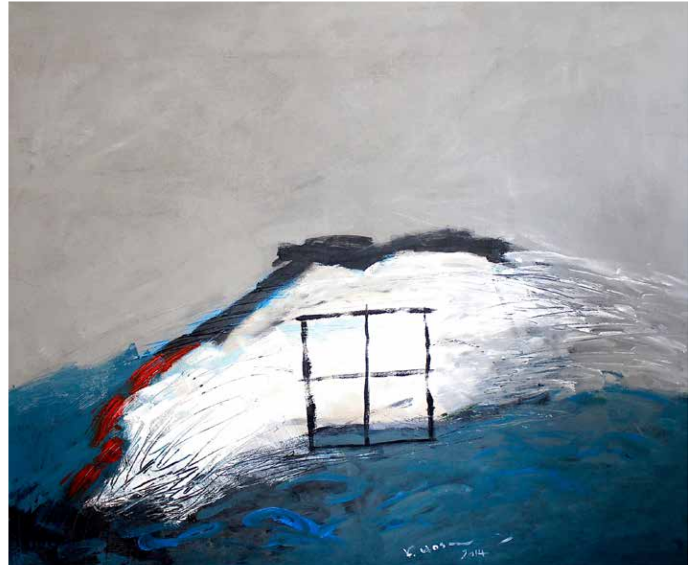
Acrylic Painting on Canvas 100 x 120 cm 2014