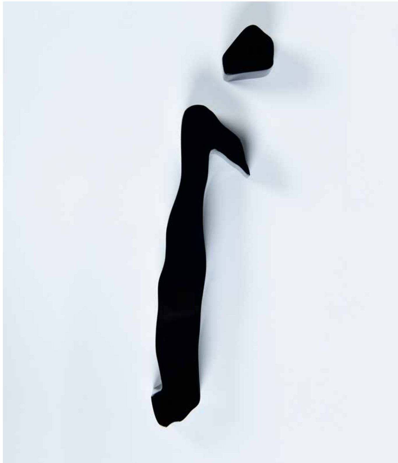
The Point Painting on Aluminum 70 x 50 x 6 cm 2021