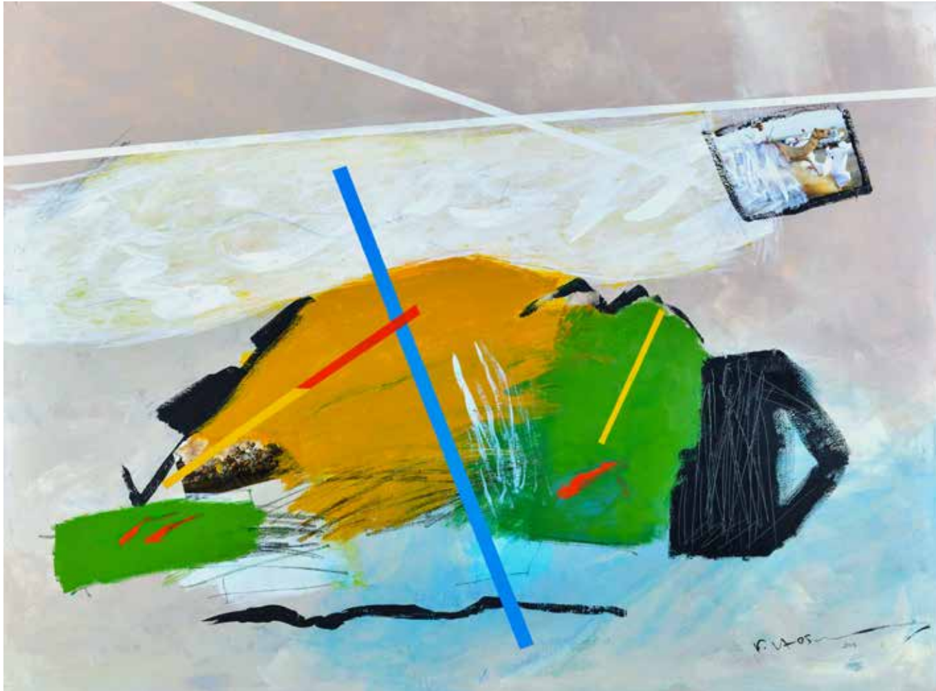
Acrylic Painting on Canvas 150 x 200 cm 2018