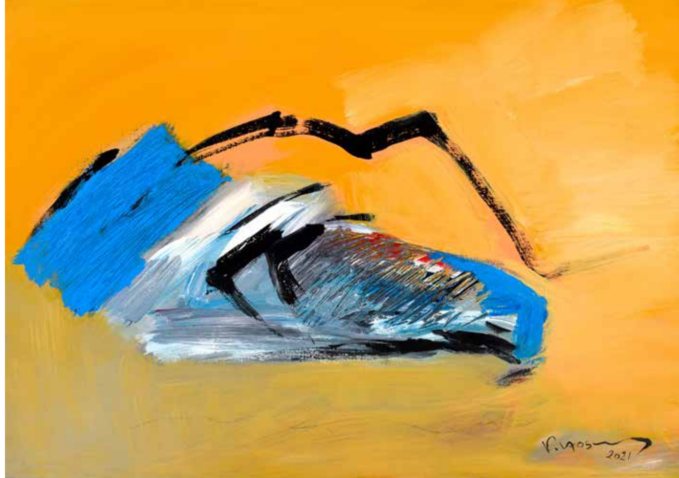
Acrylic Painting on Canvas 50 x 70 cm 2021

إن الأعمال الفنية التي ينسجها فاروق حسنى بوحى من خياله ، كانت وليدة اللحظة ، فاللوحة متوهجة ببريق متغير من الألوان حيث الألوان تتناثر كنقاط تتلاحق وتتقاطع مع بعضها البعض .