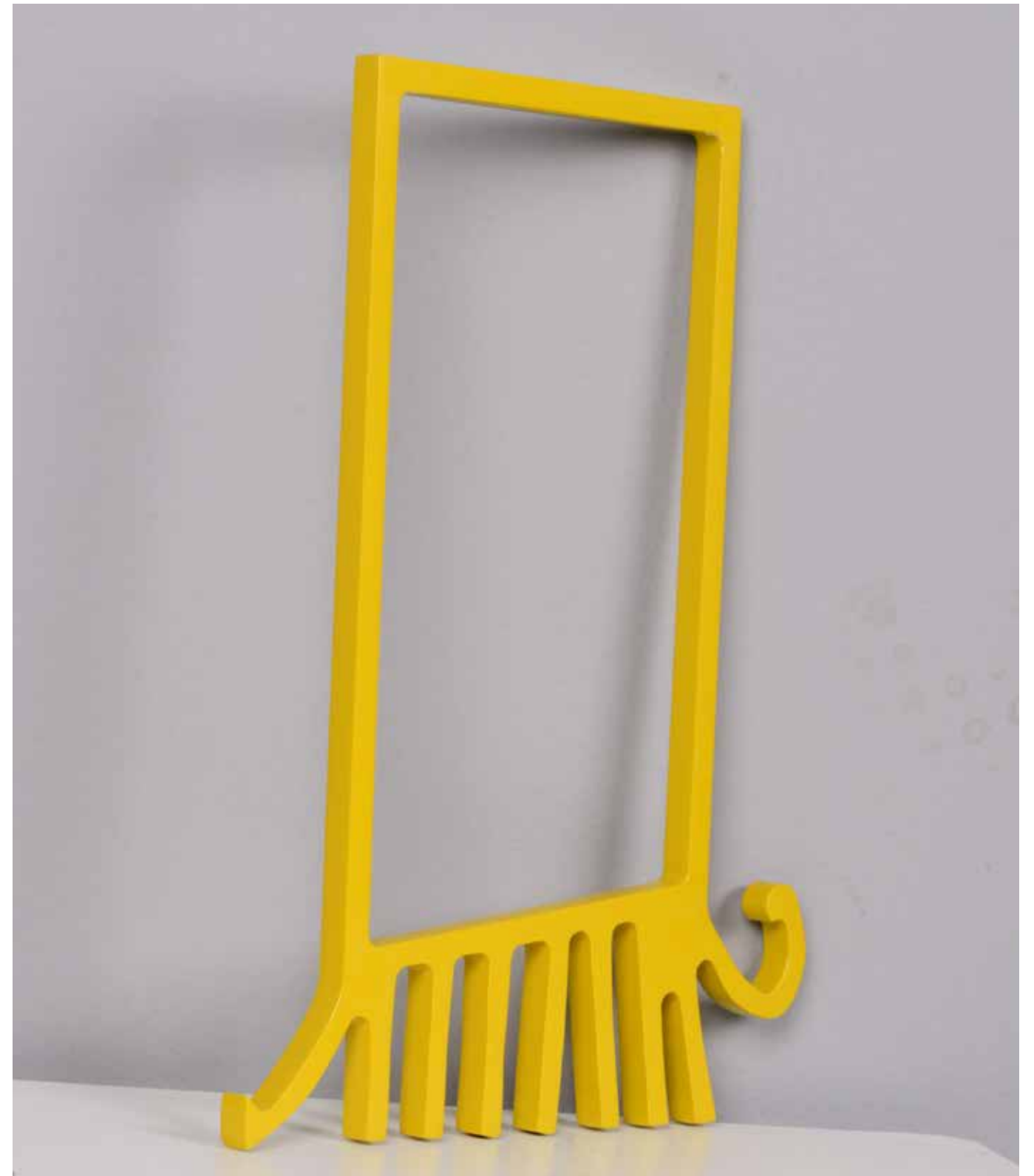
Modern Window Painting on Aluminum 70 x 50 x 6 cm 2021