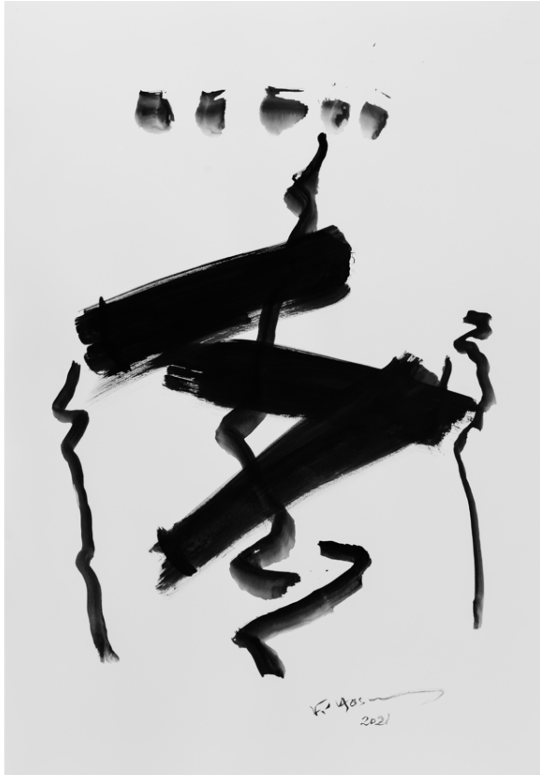
Ink on Paper 70 x 100 cm 2021