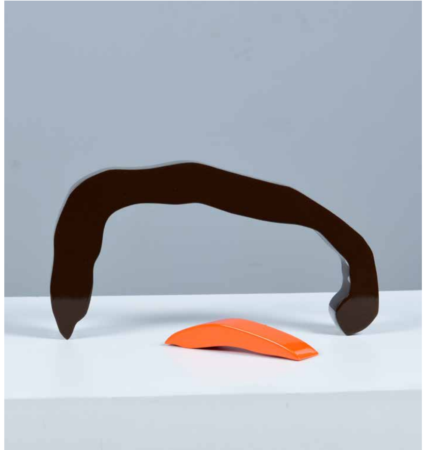
Relationship Painting on Aluminum 70 x 50 x 6 cm 2021