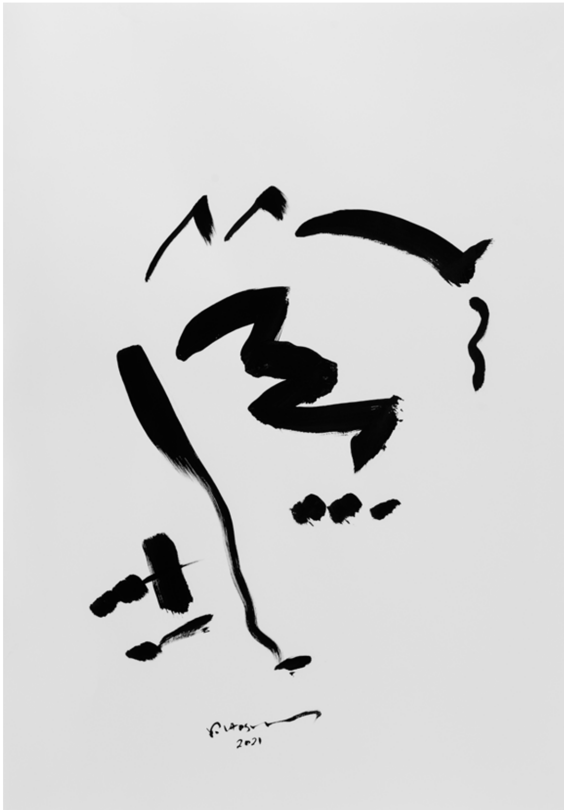
Ink on Paper 70 x 100 cm 2021