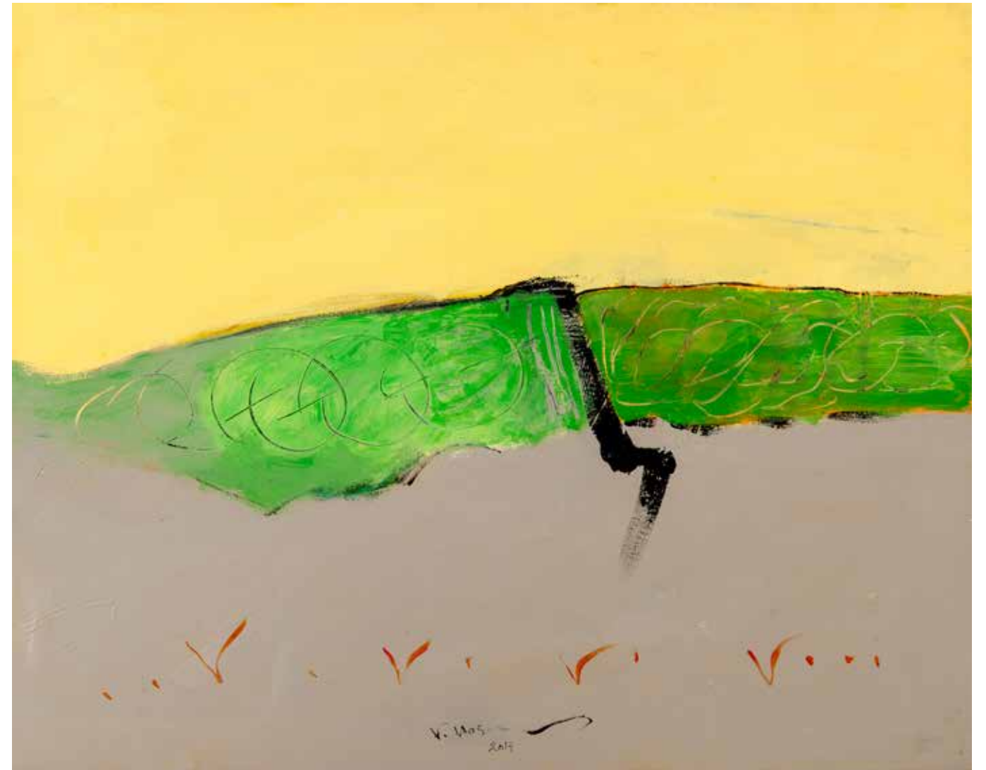
Acrylic Painting on Canvas 80 x 100 cm 2017