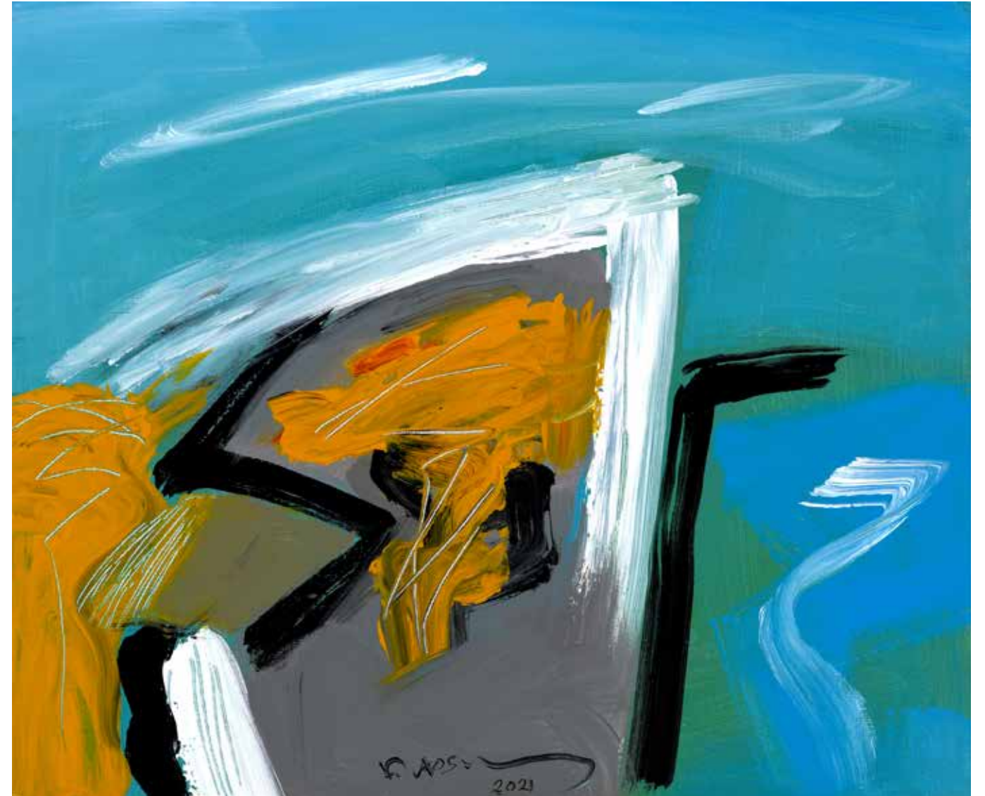
Acrylic Painting on Canvas 50 x 60 cm 2021