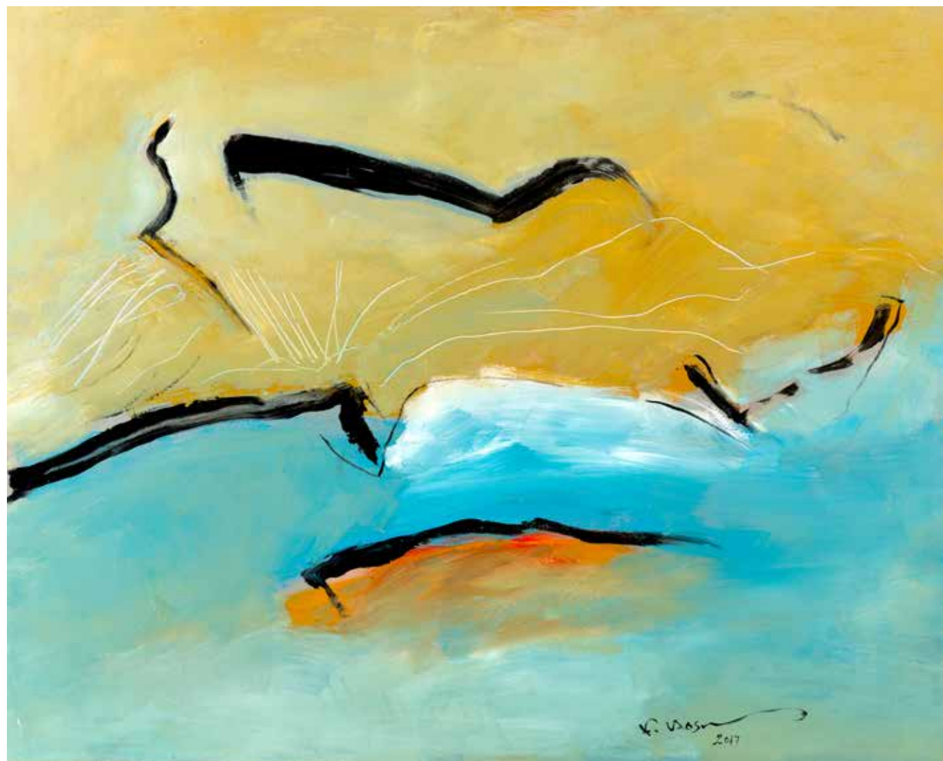
Acrylic Painting on Canvas 80 x 100 cm 2017

يمكن بسهولة وضع أعمال فاروق حسنى فى منظور تاريخى فهى تذكرنا بألوان « ماتييس » و « بول كلي » المستوحاة من المغرب العربى ، والأراضى المبهجة لـ « آفرو » ورموز وعلامات « تاييس » المتشابكة والمتداخلة ، فهى تعكس تأثيرات هؤلاء الفنانين الذين قدموا لنا ولمدة نصف قرن من الزمان برموز قليلة ولمسات من الألوان لكل إنفعالات وأحاسيس المناظر الطبيعية التى لوجود لها إلا فى الأحلام فقط .