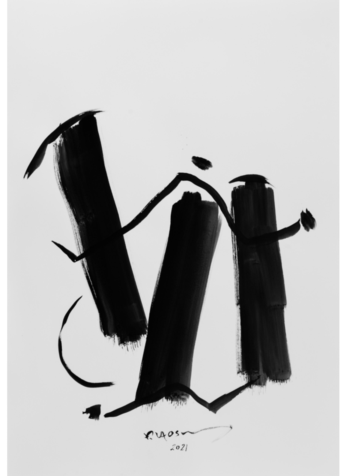
Ink on Paper 70 x 100 cm 2021