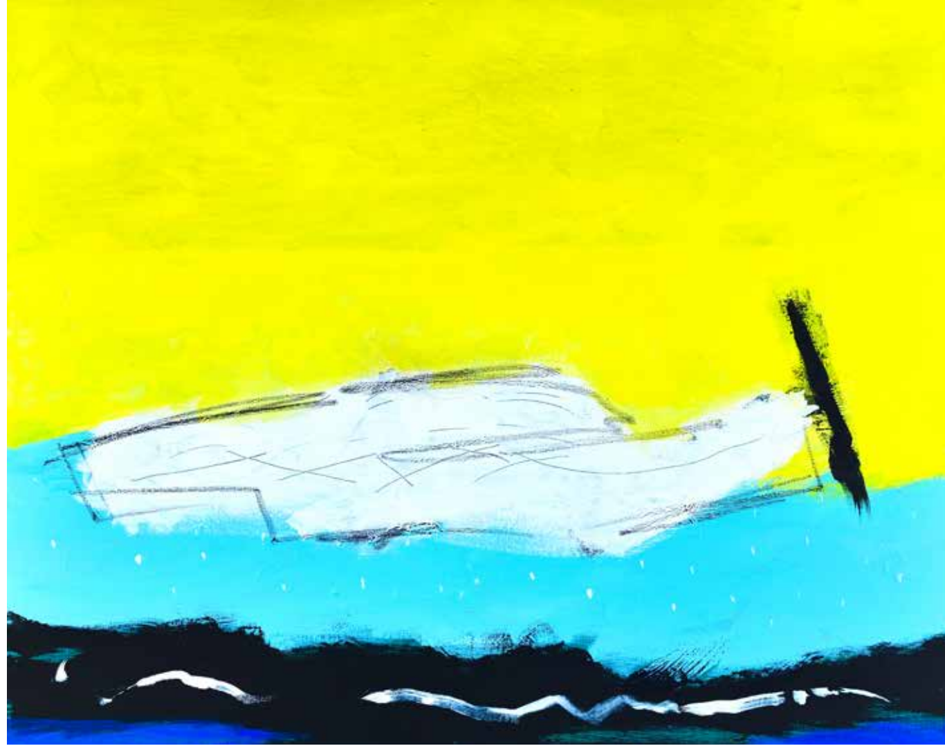
Acrylic Painting on Canvas 120 x 120 cm 2019

« يشير فن فاروق حسنى التجريدى بقوة إلى إدراكنا إمكانية وجود الأشكال المطلقة – سواء كانت لها بنية أم لم تكن – وإلى أن هذه الأشكال تشع ضوءاً مستديماً من مصدر خاص بها ، وإلى أنها تتجلى بغموض وعفوية من قلب العتمة .»