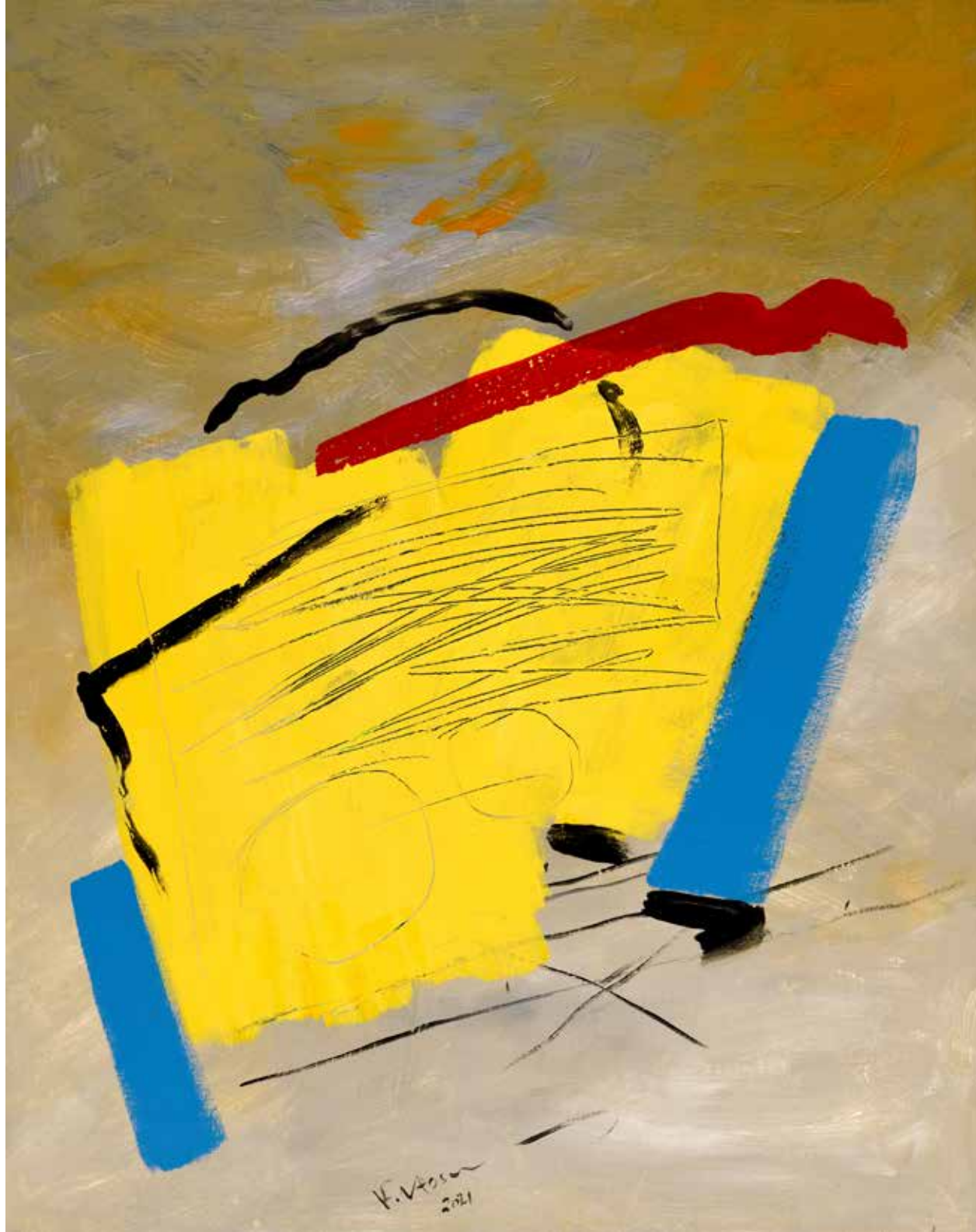
Acrylic Painting on Canvas 100 x 80 cm 2021

تذكرني لوحات فاروق حسنى بارتجالات كاندنسكى فى تجريده المبكر وضربات الفرشاة الدوامية والعنف فى تعبيرهما .