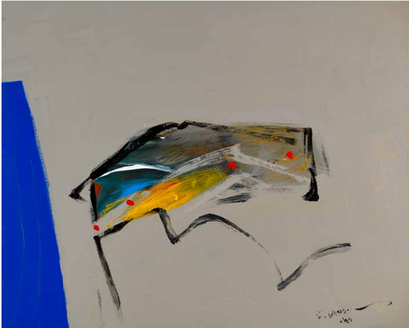
Acrylic Painting on Canvas 80 x 100 cm 2021