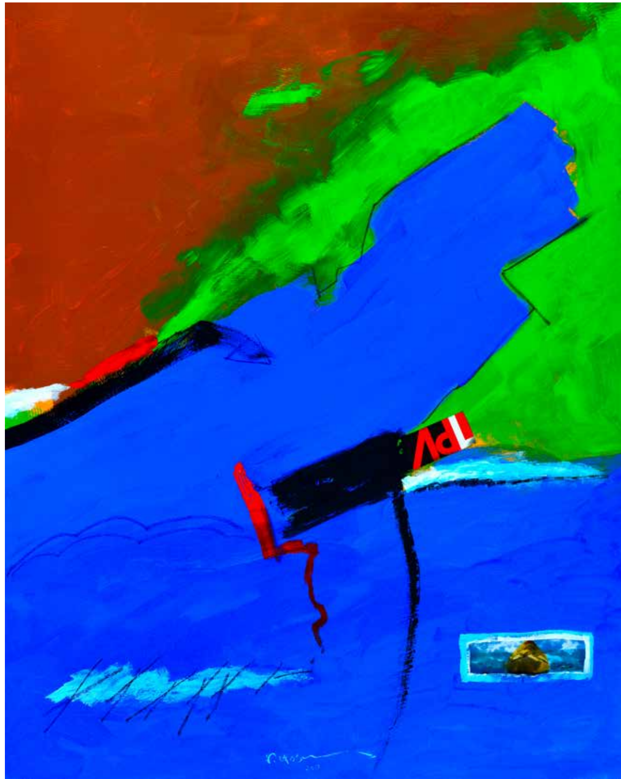
Acrylic Painting on Canvas 150 x 120 cm 2018