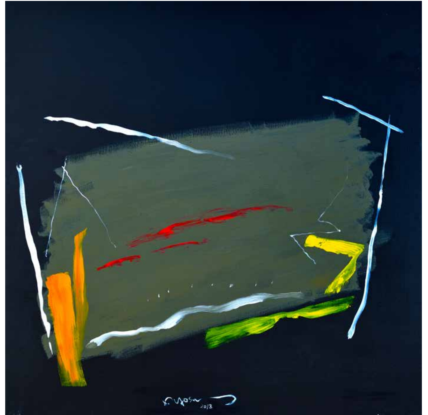
Acrylic Painting on Canvas 120 x 120 cm 2018