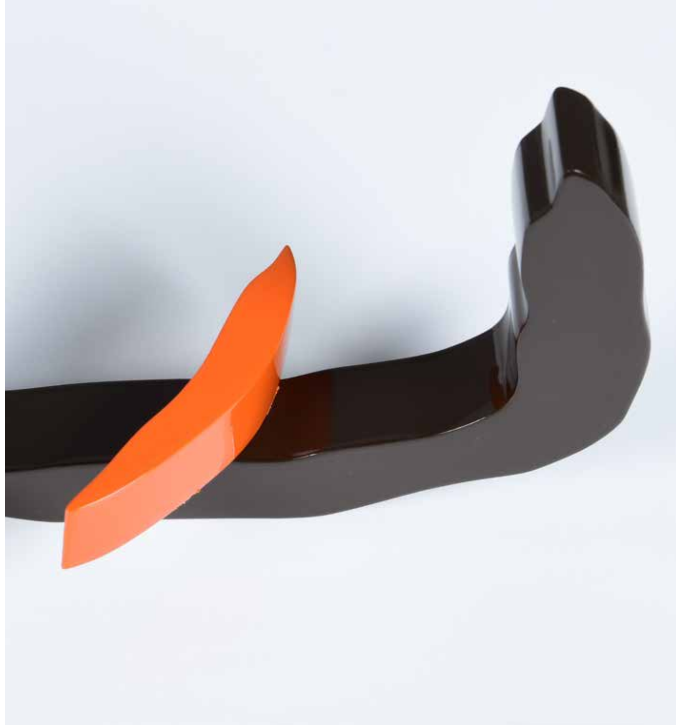
Relationship Painting on Aluminum 70 x 50 x 6 cm 2021

قد يتصور البعض أن فاروق حسنى لا يقول شئ من خلال رسومه وألوانه ، إلا أن إختلاف المذاق بين عمل وآخر وتغير الجو النفسى وتراوح الشعور بين البهجة والحزن من لوحة لإخرى يؤكد أن الفنان يهمس لنا بأشياء يبتها فى أرواحنا وليس فى آذاننا .