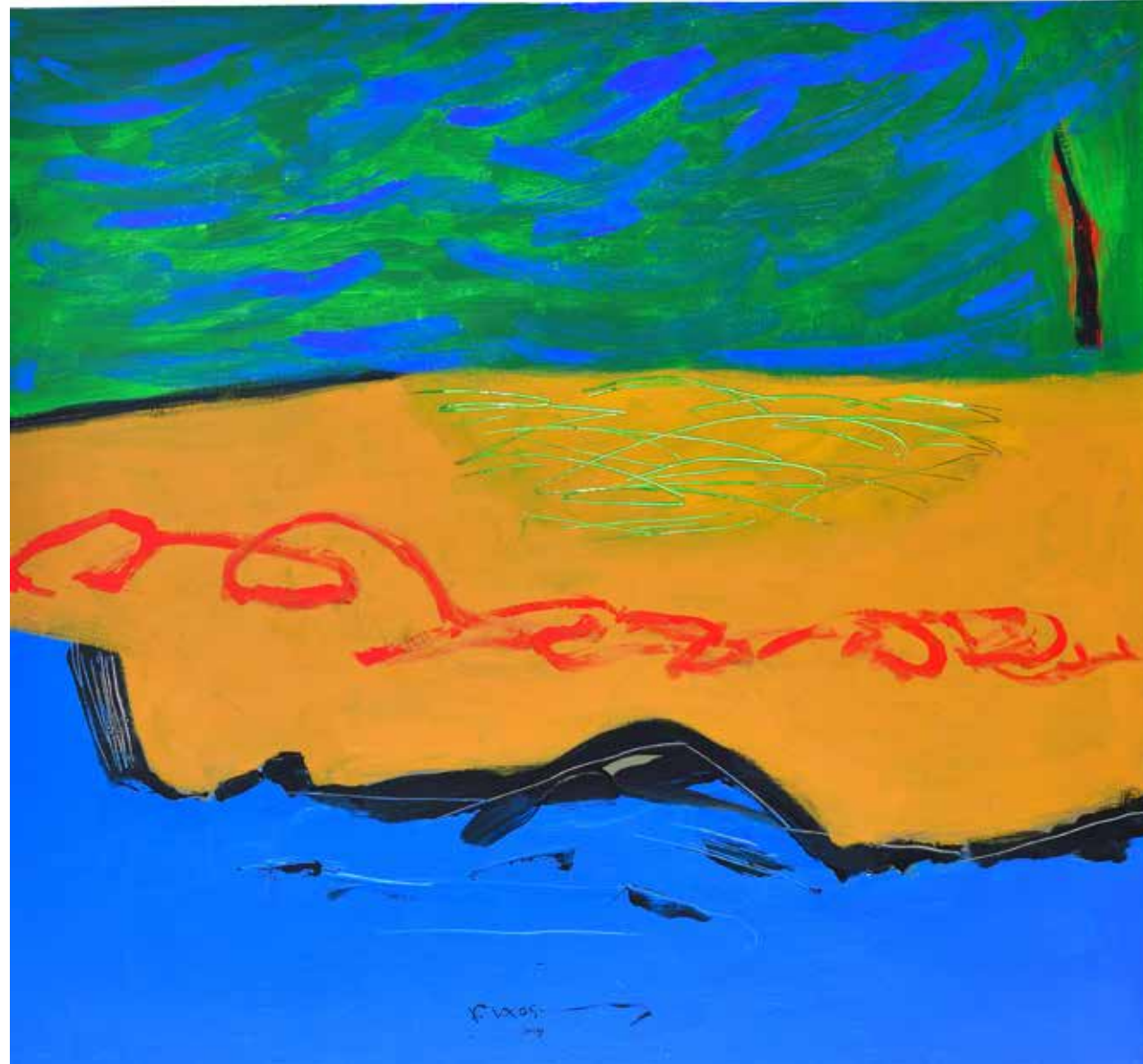
Acrylic Painting on Canvas 150 x 120 cm 2019

لوحات فاروق حسنى تتحدث لغة العالم الحديث ، حيث أنها مؤلفة فى توازن رائع وإبهام صوري وديناميكية أطياف الألوان .