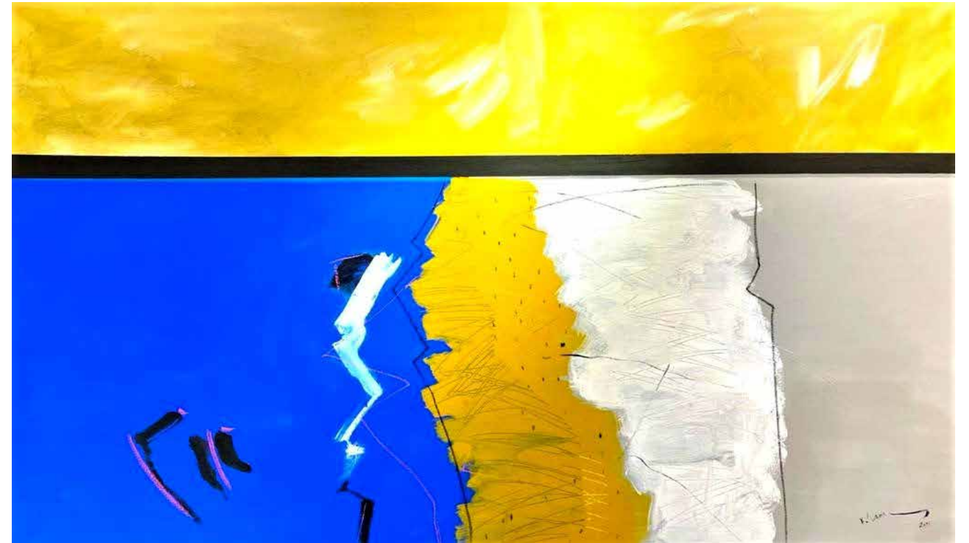
Acrylic Painting on Canvas 120 x 200 cm 2021