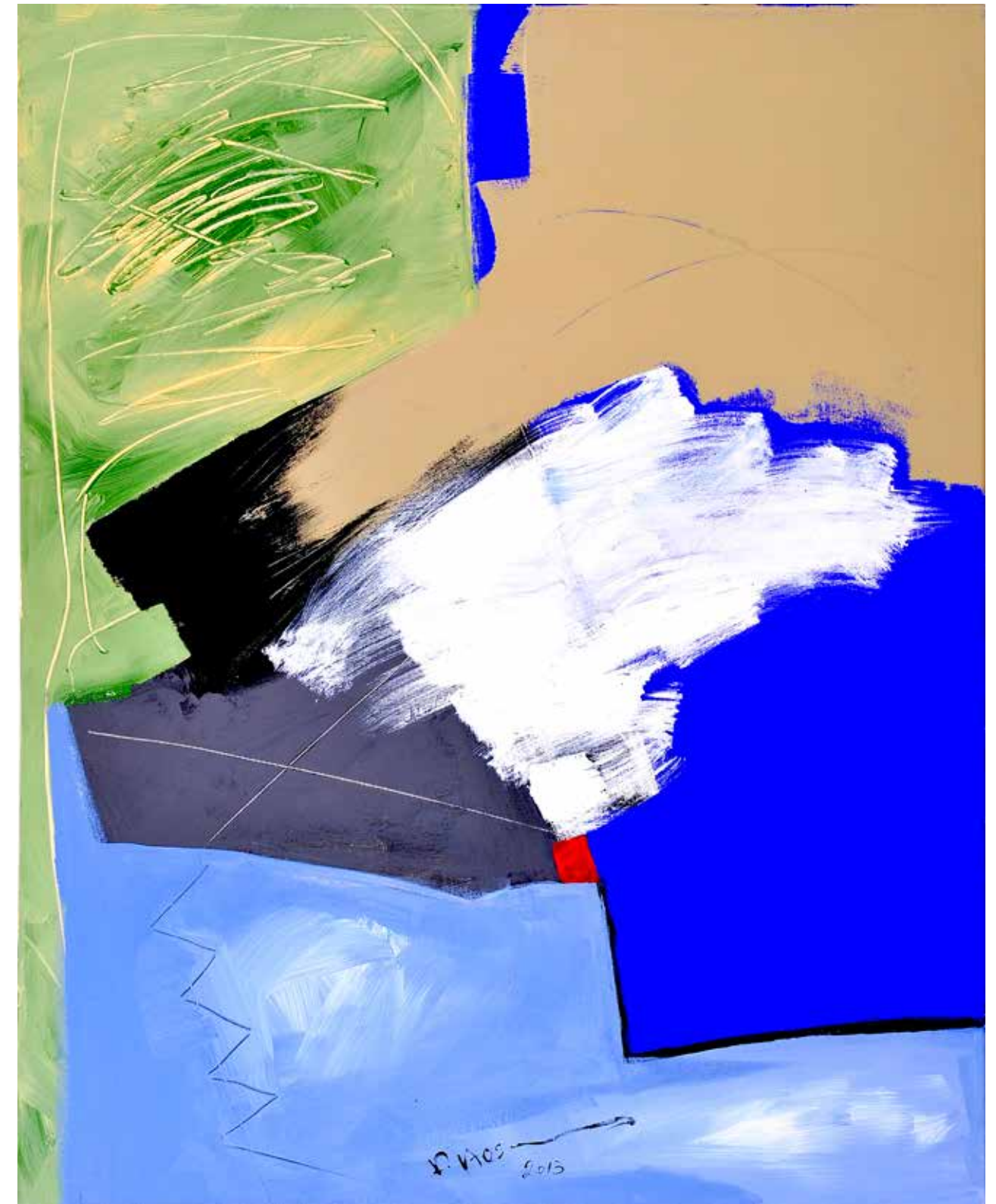
Acrylic Painting on Canvas 100 x 80 cm 2013