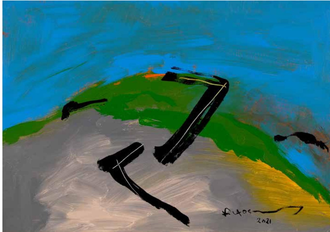
Acrylic Painting on Canvas 50 x 70 cm 2021