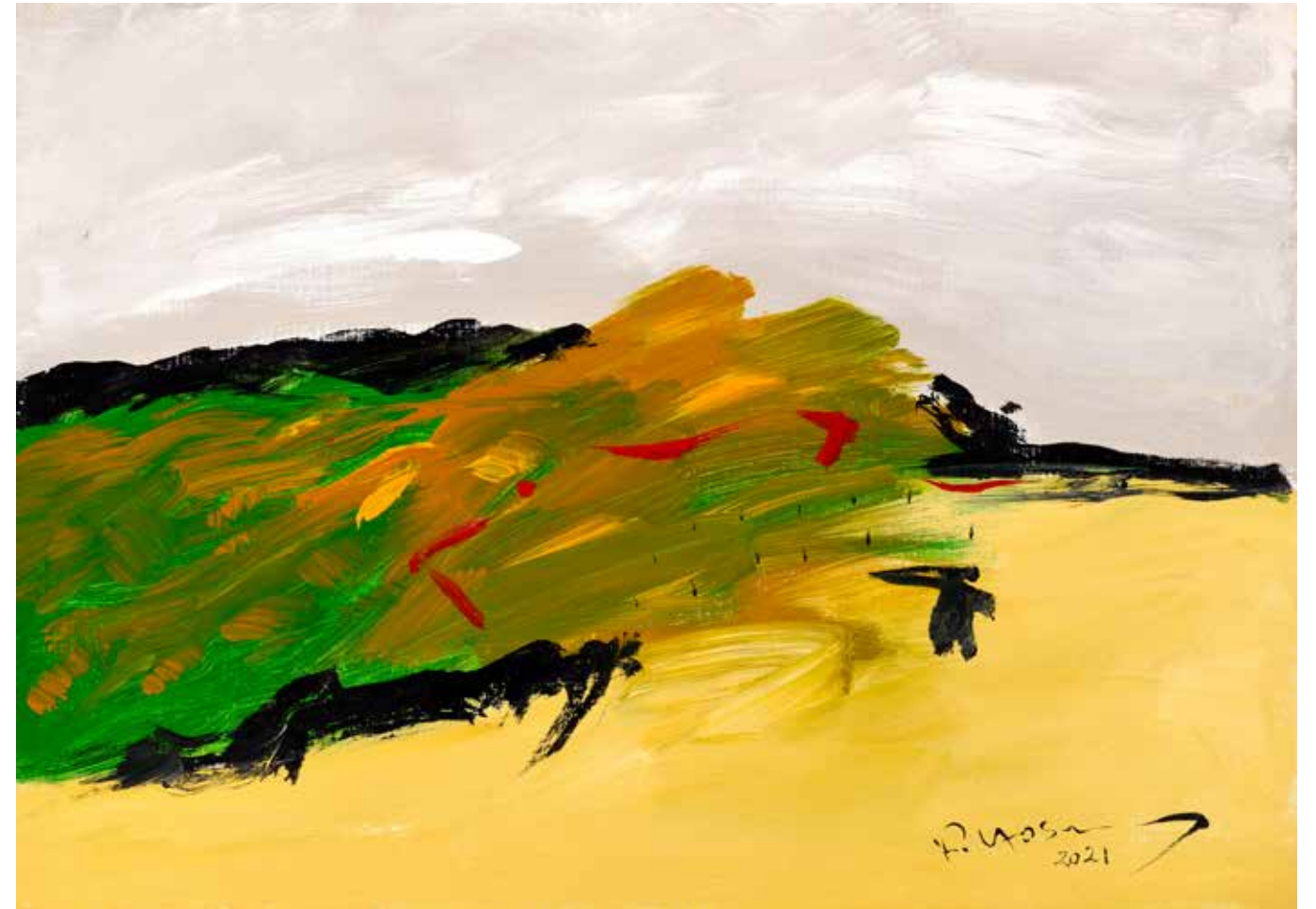
Acrylic Painting on Canvas 50 x 70 cm 2021