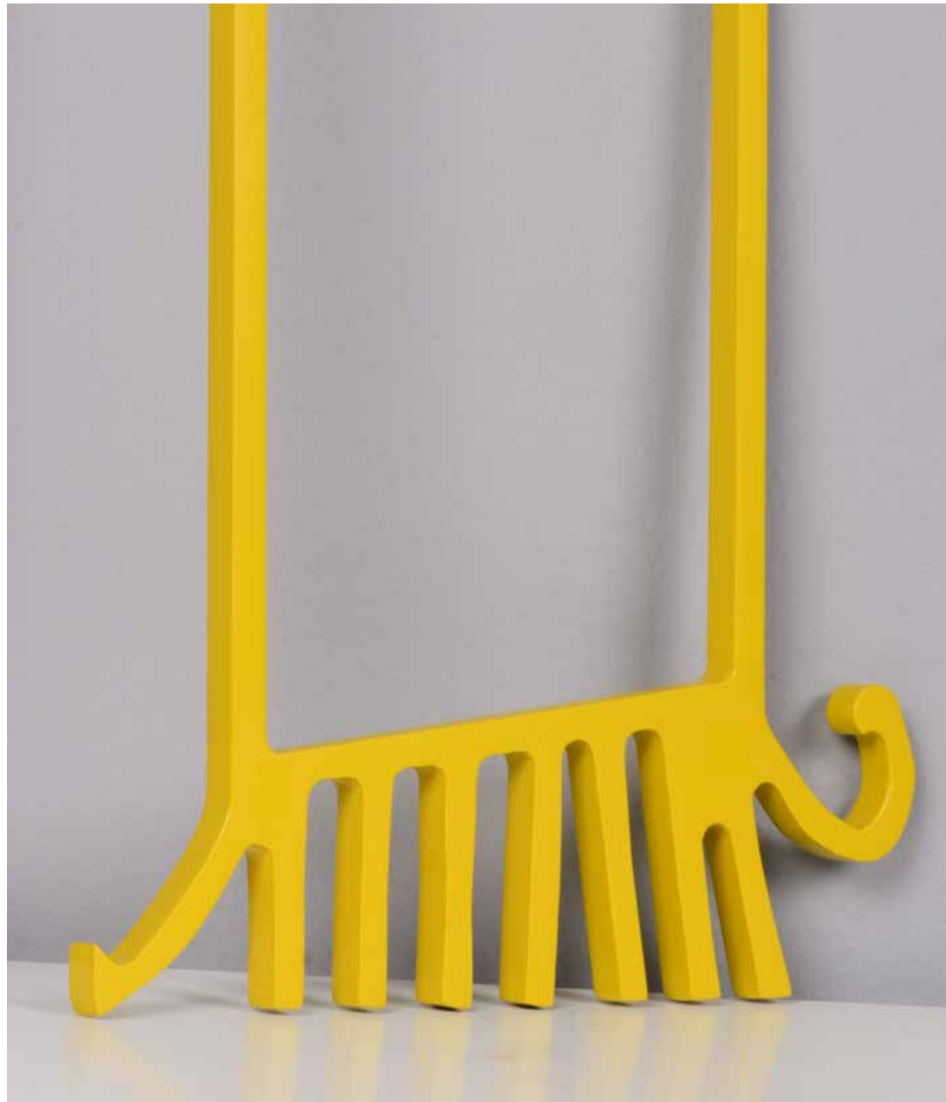
Modern Window Painting on Aluminum 70 x 50 x 6 cm 2021