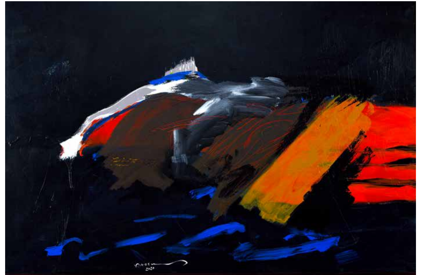
Acrylic Painting on Canvas 100 x 150 cm 2020