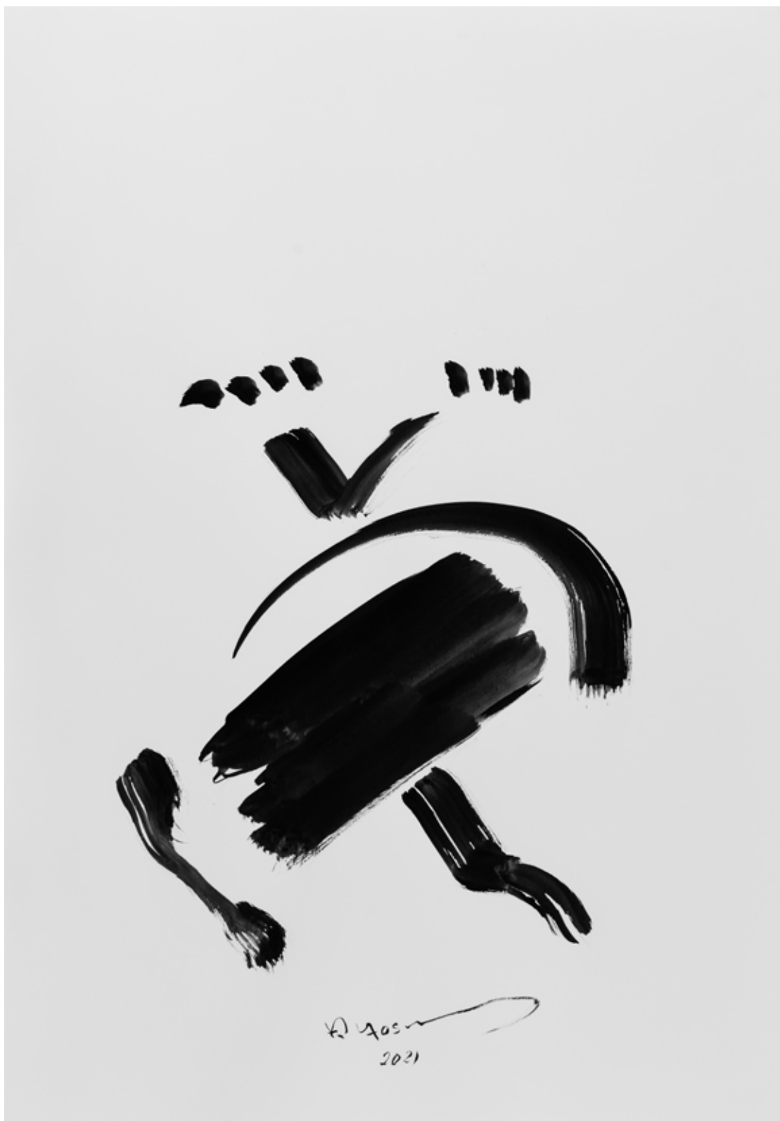
Ink on Paper 70 x 100 cm 2021