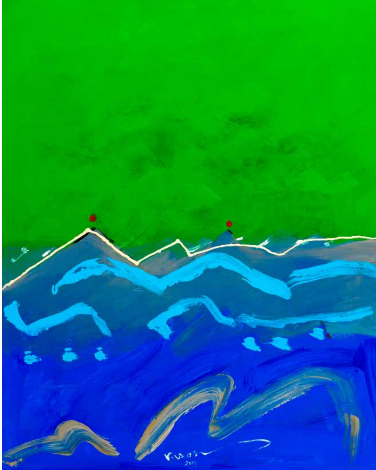
Acrylic Painting on Canvas 100 x 80 cm 2017

إن لوحات فاروق حسنى مليئة بالحرارة والإحساس . ويتضح ذلك من الأشكال المنسقة إلي جبال ، وسماء تضيء ، وليالي بنفسجية تتحلل إلي أمواج صاخبة من اللون الأخضر والأزرق والرمادي مثل اللؤلؤ لأنه يعرف كيف يحدد كل تجربة ببراعة .