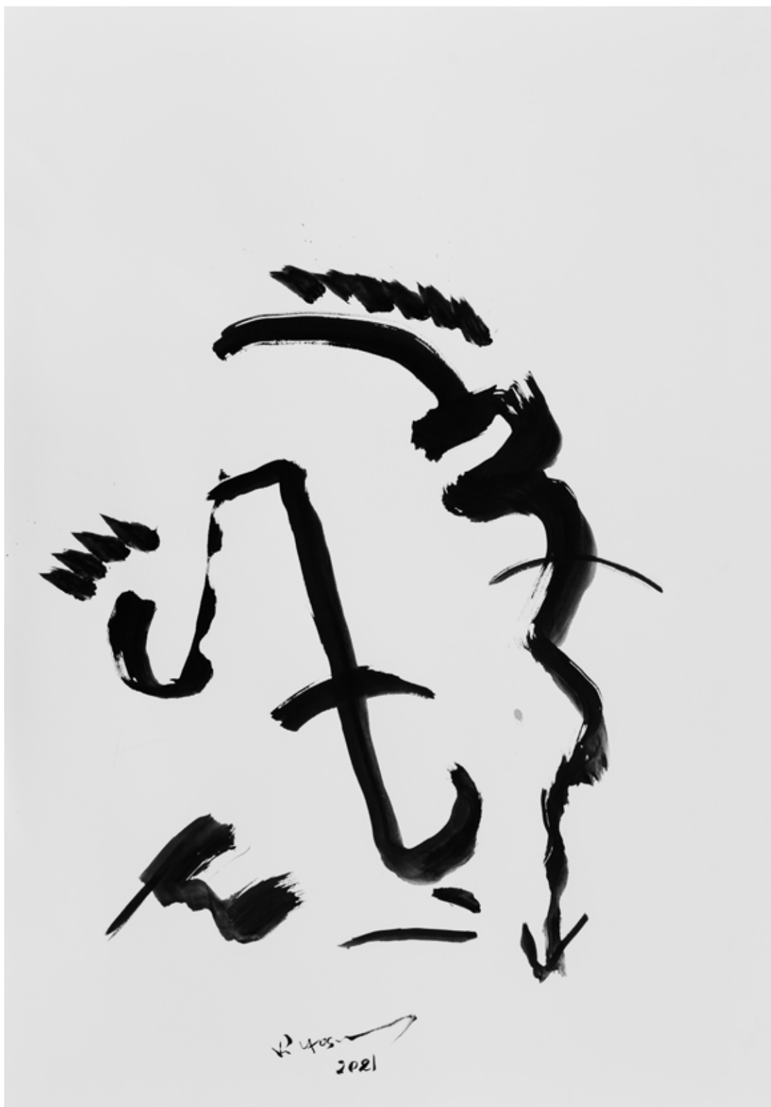
Ink on Paper 70 x 100 cm 2021