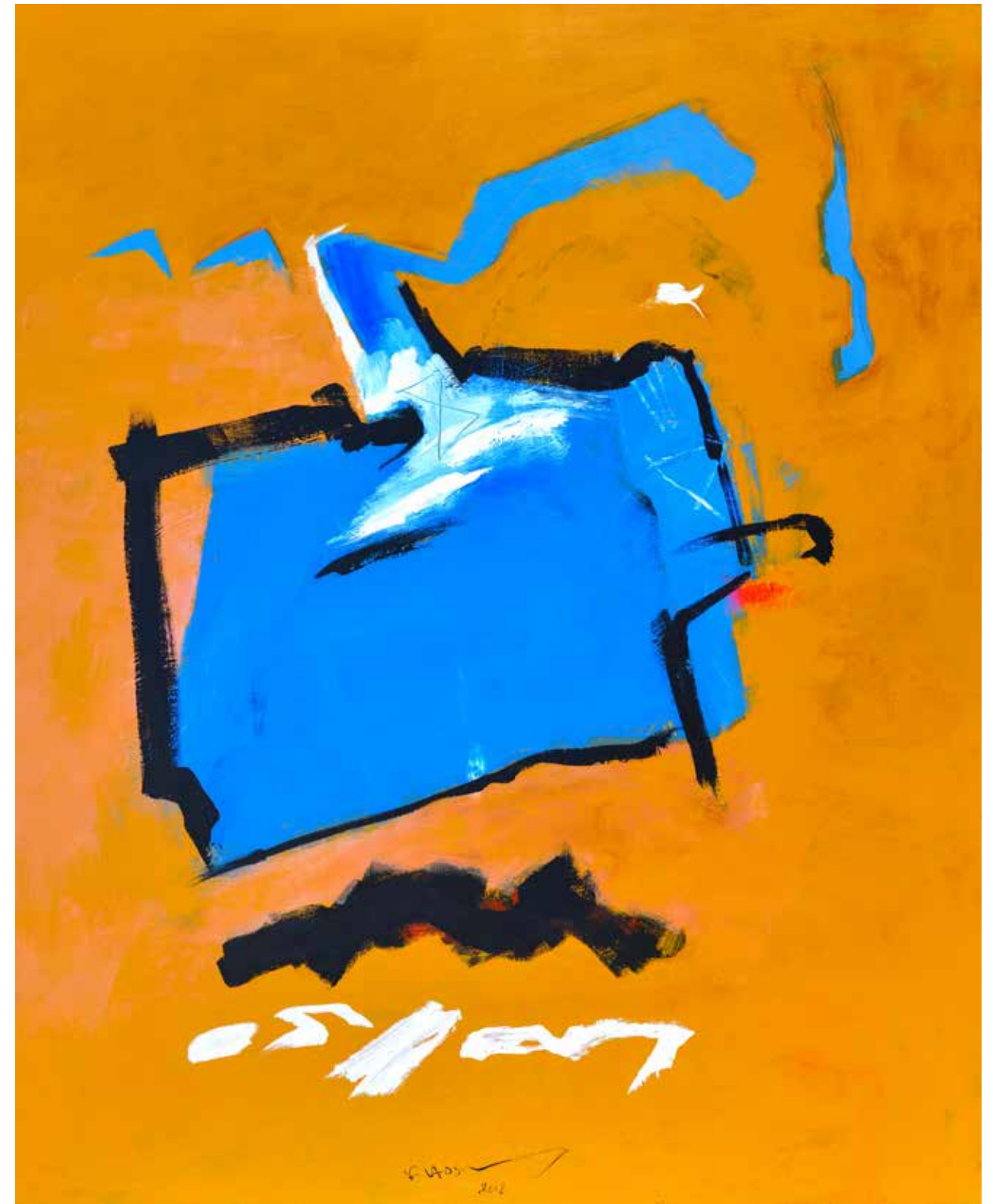
Acrylic Painting on Canvas 150 x 120 cm 2018