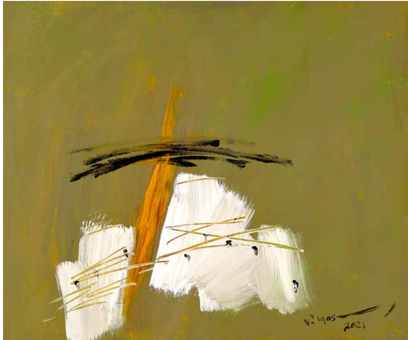
Acrylic Painting on Canvas 50 x 60 cm 2021